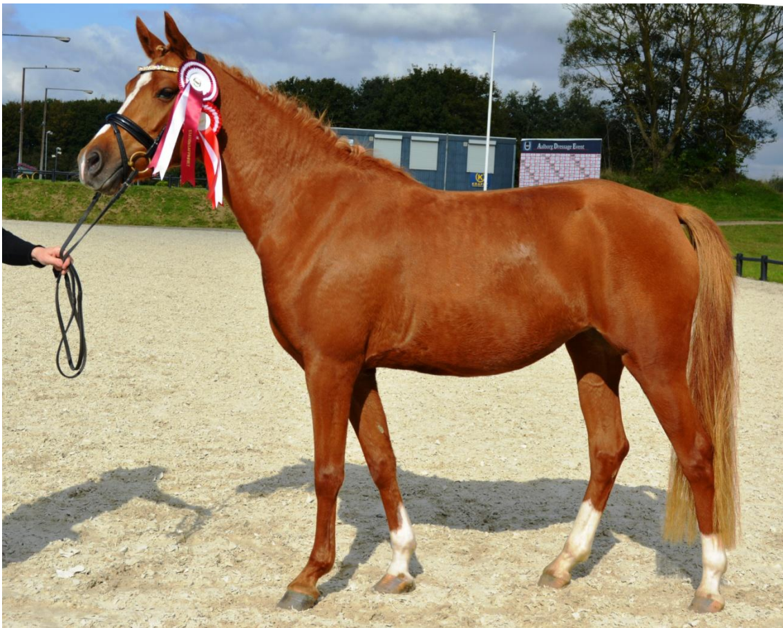
POPPELGÅRDENS RAVAGE B