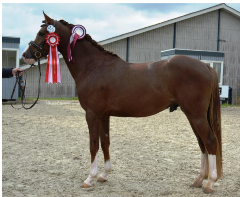
Disciplinvinder i springning