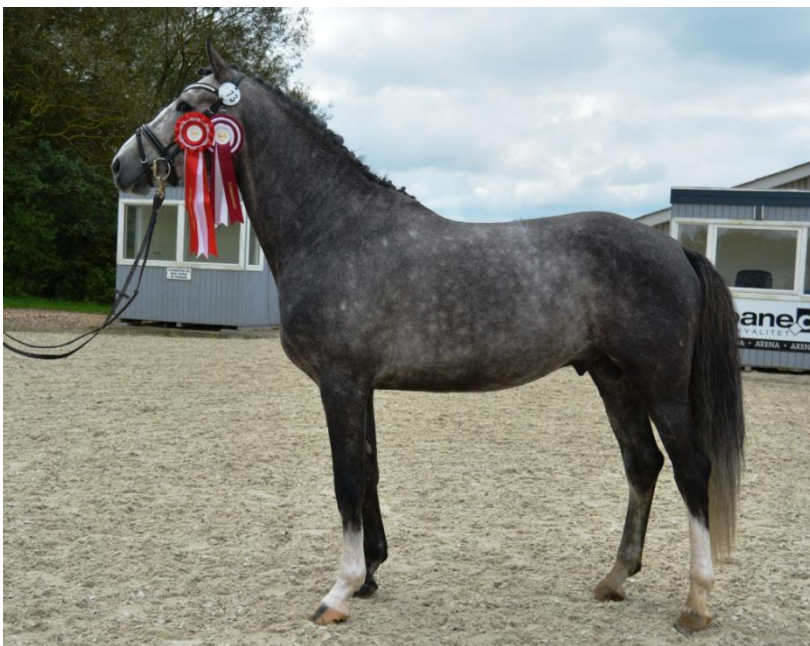
Disciplinvinder i dressur